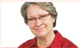
COUP DE CŒUR DE LA RECHERCHE

Supérieure provinciale des Sœurs de la Providence, Province Émilie-Gamelin