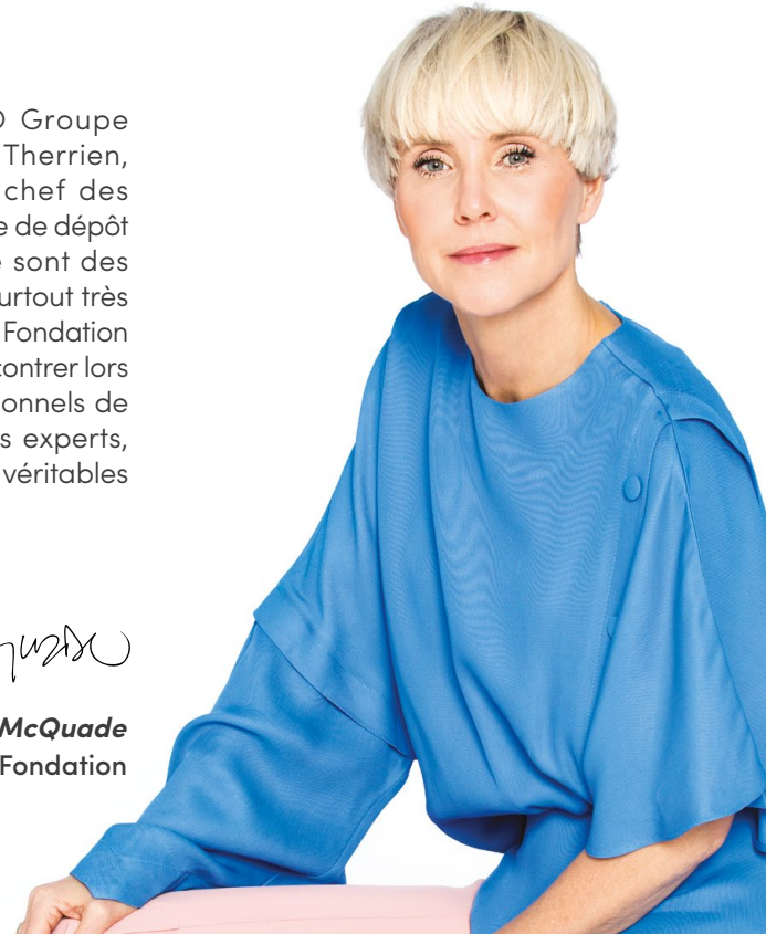
Pénélope McQuade Porte-parole bénévole de la Fondation