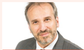
COUP DE CŒUR DE L'ENSEIGNEMENT

Chercheuse au Centre d'études avancées en médecine du sommeil (CEAMS)